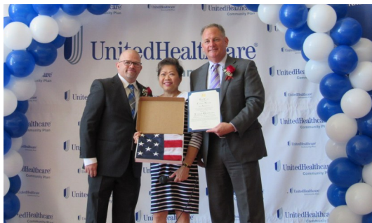
聯邦眾議員 Al Green 的代表致贈議員對新中心開幕的祝賀，由德州首席執行長 Donald Langer 代表接受

(記者韋冕休斯頓報導) 現代人重視健康，而在美國，複雜的醫療系統常常讓人摸不著頭緒，尤其是對第一代移民。針對亞裔民衆的需要，聯合健康保險於休斯頓最新設立了亞裔資訊服務中心，以三種亞洲語言提供更進一步的健康諮詢服務、以及教育活動，讓民衆不受語言的隔閡，能接收更多健康資訊。休斯頓亞裔資訊服務中心於五月八日舉行盛大的開幕活動，休斯頓的社區賢達