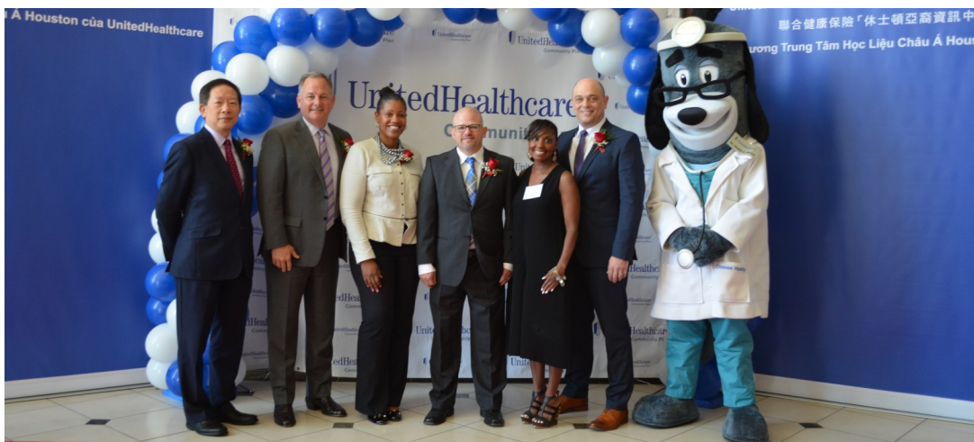
聯合健康保險的高層人士們專程參加新店面的開幕儀式